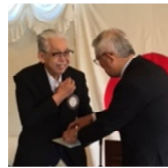
出町(初)の金賞 管楽器クラブ 全日本小学校バンドフェスティバル 参加の支援金贈呈しました。